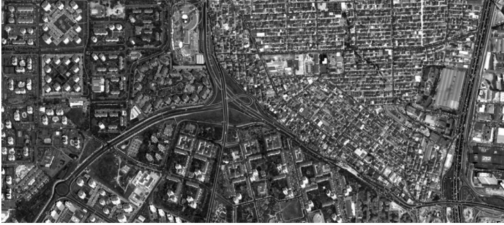
Şekil 2: İstanbul, İkitelli Mehmet Akif Mahallesi.