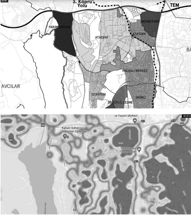
Şekil 3 ve 4: Küçükçekmece bölgesinden kent95.org ve HES uygulaması verileri (Harita: Murat Tülek). 10

orta-orta alt rayiç beделе sahip semtlerde ise evde kalinamadığı görsel olarak paylaşılmıştı. Kentsel eşitsizlik koşullarımız, kentsel mekanı kullanımımızdaki yoksunluğun dışında zaten varolan ancak pandemide daha görünür kılınan, sağlığınıza da belirleyenlerden olduğunu göstermektedir.