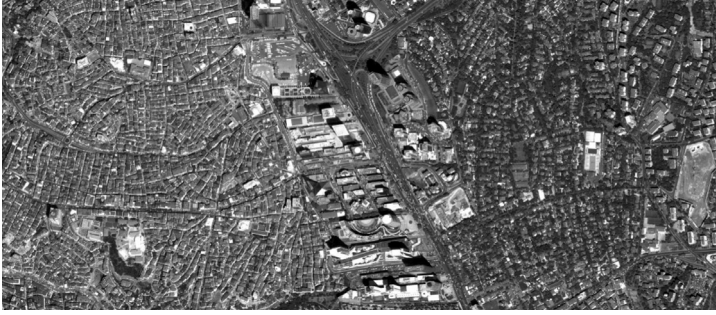
Şekil 1: İstanbul, solda Çeliktepe Mahallesi, sağda Akatlar mahallesi ve aradan Büyükdere Caddesi iki mahalleyi bölmekte.